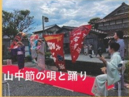
山中節の唄と踊り