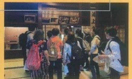
北前船の里資料館