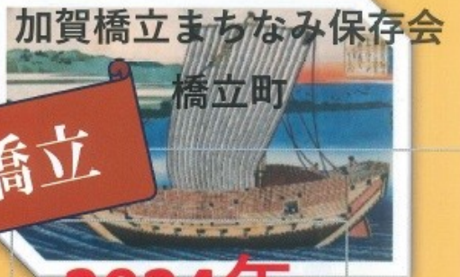
加賀橋立まちなみ保存会 橋立町