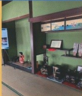
忠谷家 (重要文化財) (コーヒーセット販売)