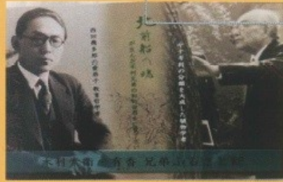
木村素衛・有香ふるさと館