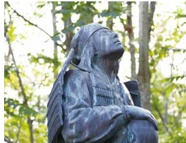
首洗池、義仲悲涙の像

篠原古戦場は、寿永 2 年 (1183) に倶利伽羅の戦いで敗走した平家軍が、木曾義仲に最後の抵抗を試みて敗れた地です。平家の老將 斎藤別当実盛は、かつて義仲の命を助けた恩人でしたが、正々堂々と戦うために白髪を黒く染め正体を隠して出陣し、手塚太郎光盛に討たれました。討ち取られた首を洗うとそれが恩人実盛だとわかり、義仲は涙したと伝えられます。「首洗池」はその首を洗った池であるといわれ、義仲が悲涙にくれる名場面の像が建っています。また、奥の細道でこの地を訪れた芭蕉が詠んだ「むざんやな甲の下のきりぎりす」の句碑も池のほとりに建てられています。