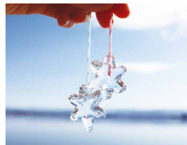
実験で作る氷のペンダント

片山津の自然美を表情豊かに感じられる本施設は、2019年にブリツカ一賞を受賞した磯崎新氏による設計。六角形の塔は雪の結晶をイメージしたものです。