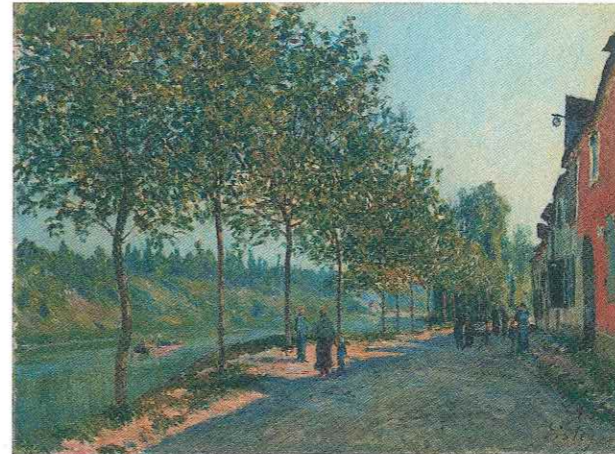
アルフレッド・シスレー 《サン=マメス六月の朝》 1884年 油彩・カンヴァス 石橋財団アーティゾン美術館