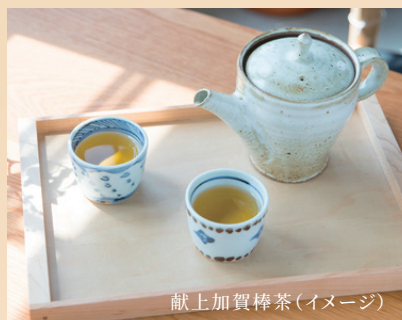
献上加賀棒茶 (イメージ)