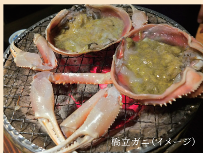
橋立ガニ (イメージ)