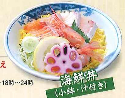
海鮮丼 (小鉢・汁付き)

☎ 不定休 🕒 11時30分~15時・18時~24時 ☎ 0761-74-8564