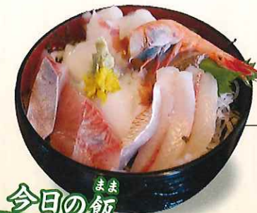
今日の飯 (小鉢・汁付き)

価格:1,800円(税別) 「売り切れ御免!」マルヤ水産直営だから、今日の新鮮な地魚を「漁師の飯」風で頂く海鮮丼。